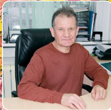
Сегодня день у вас особый: День накануне торжества. И праздник ваш, хоть

В ходе заседания президиума Обкома Профсоюза были рассмотрены итоги правозащитной деятельности областной организации Профсоюза за 2017 год, состояние профсоюзного членства за минувший год, подведены итоги смотра-конкурса на лучшего уполномоченного по охране труда и другие вопросы.